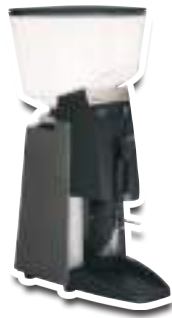
55 BM Skiny grey Gris émerisé