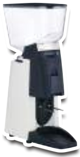
55 W White Blanc