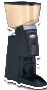
55 BAR Black Noir