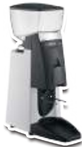
55 WBC White Blanc