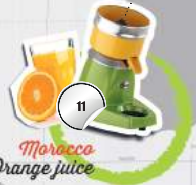
Morocco Orange juice