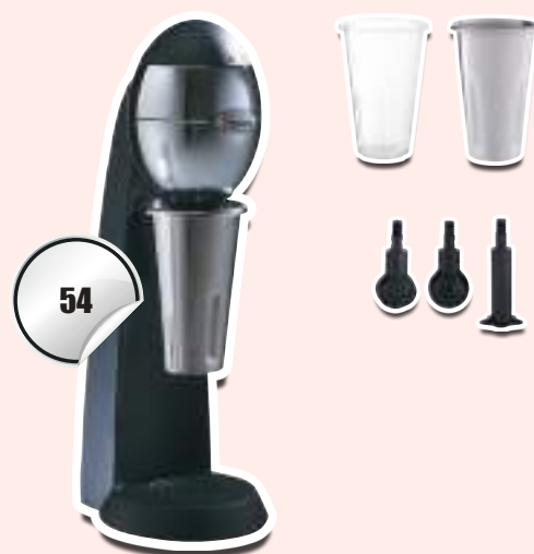
54 Black Noir

Socle peint (33E – 33GE) ou socle chrome (33CE)