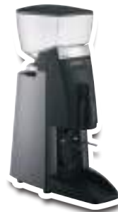
55 BMS Skiny grey Gris émerisé