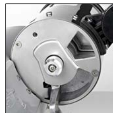
Tuerca ajuste fuera del dosificador. Contador de cafés. Easy close adjustment. Analogic coffee counter.