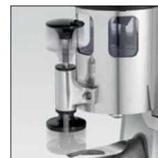
Prensa telescópico. Telescopic tamper.