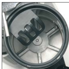
Estrellas y maneta de aluminio. Regulación entre 5,5 y 10 gr. Stars and lever made of aluminium. Dispenser unit adjustment 5.5 - 10 g.