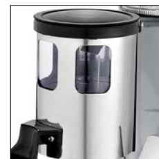
Capacidad dosificador 250 g. Doser capacity 250 gr.