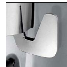
Maneta derecha. Right hand dispenser.