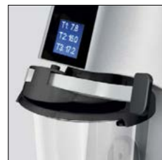
Leva bloca vaso Beaker locking lever