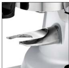
Horquilla de aluminio. Aluminium fork.