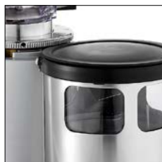
Paro automático doble micro. Cada 6 golpes se pone en marcha. Dosificador siempre lleno, dosis precisas. Auto-stop. Auto refill system with two microswitches. Every six shots starts to grind. Dispenser always full. Precise doses.