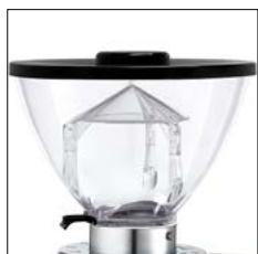
Tolva 500 gr. Coffee bean hopper 500 g.