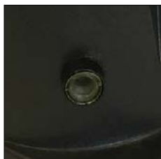
Temporizador para configurar tiempo dosis. Timer to set dose time.