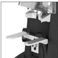
Horquilla regulable Adjustable Fork