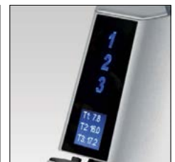
Display (3 programas memorizables) Touch display (3 memory programs)