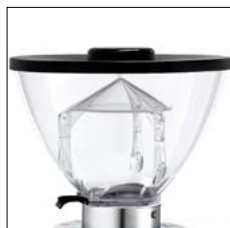
Tolva 250 gr. Coffee beam hopper 250 g