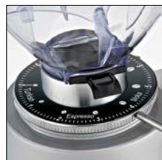
Regulación molienda micrométrica Micrometric grinding adjustment