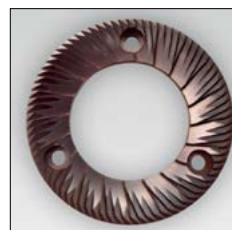
Fresa larga duración. Red speed blades.